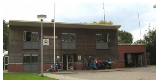
De Craenenborgh. (2015, 17 december). [Foto]. Hart van Holland. http://www.hvonline.nl/pages/posts/scouts-willen-beheer-over-eigen-pand-niet-kwijt-50809.php?p=134&s=211

In 2002 verhuisden we naar ons huidige clubhuis. De naam van het clubhuis werd (en is nog steeds) de Craenenborgh. De vereniging ging verder onder de naam: Scouting Craenenborgh groep.